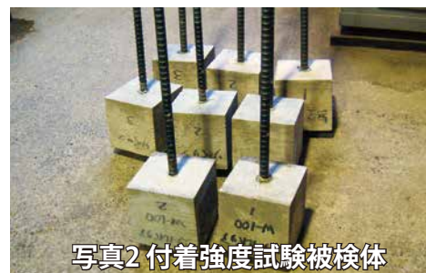
写真2 付着強度試験被検体