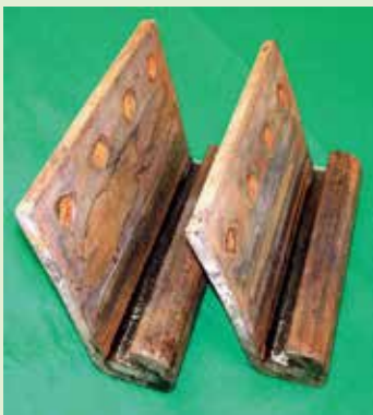
写真-14 パイルロック®NS-vを塗布した継手