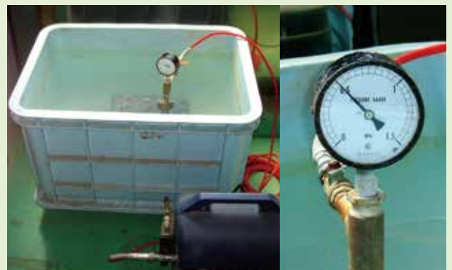
写真-16 耐圧試験の様子