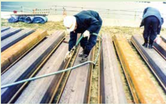
写真-3 鋼矢板の平置きとエアブロー作業

塗布する鋼矢板を塗布作業がしやすいように並べ替えます。並べ方は、一枚ずつ横に並べるか(写真-3)、鋼矢板の間に角材や鋼材を挟み、継手部にパイルロック®NS-vが流し込めるように重ねて下さい(写真-4)。