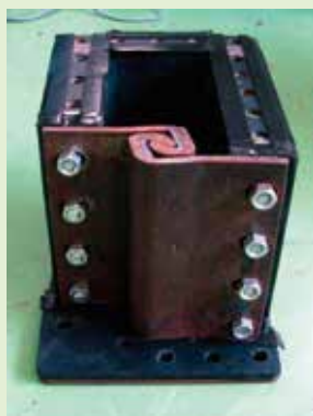
写真-15 継手のセット状態