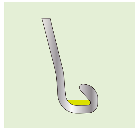
図-2 SPタイプ矢板の塗布範囲

表の塗布量は、鋼矢板両側の継手合計の塗布量です。 (例: Ⅲ型鋼矢板 1m当り片継手0.1kgづつ塗布し、両継手合計で0.2kgの塗布量となります。)