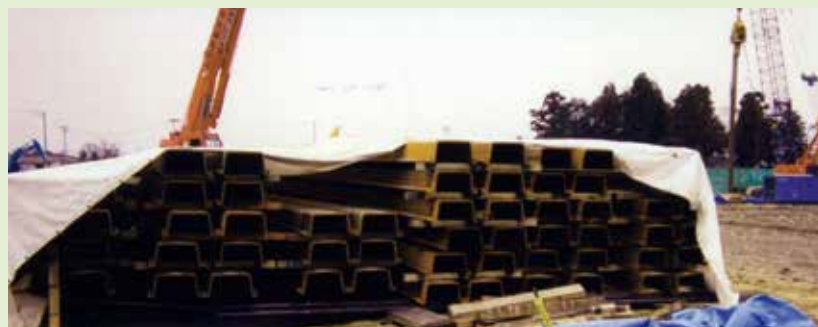
写真-10 養生(硬化)の例

※14 養生(硬化)の判定: 塗膜は硬化が完了すると、弾力のあるゴム状になります。指で塗膜を強く押して、塗膜のズレが生じずに弾力感ができれば完了です。