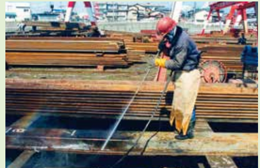
写真-12 ウォータージェットによる清掃作業