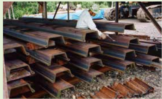
写真-4 鋼矢板の重ね置きとエアブロー作業

※3 鋼矢板の重ね作業においては、横崩れが無いように注意し、長手方向・左右方向の水平をとって下さい。