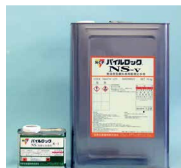
写真-2 パイルロック®NS-v