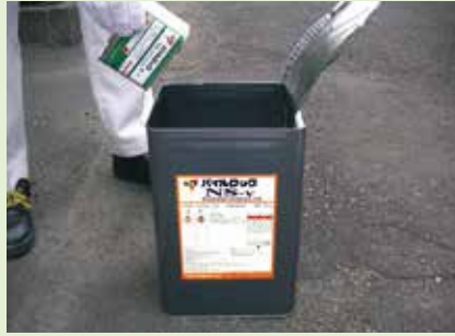
写真-6 硬化促進剤の添加