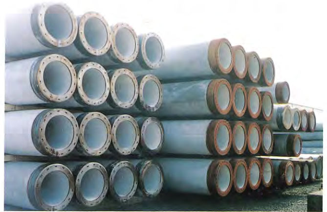
↑サルフィックスWを塗布したパイロ